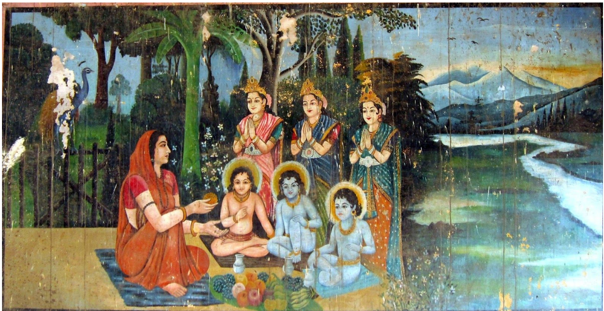
Anasuya feeding the Hindu Trinity

The story of Anusuya's family is mentioned in Bhagavata Purana Skanda III. Sage Kardama married Devahuti, daughter of Swayambhu Manu. They had ten children, one son by name Kapila Maharshi (Lord Vishnu's avatar) and nine daughters. Matha Anusuya was one among those nine daughters. Each daughter was married to a rishi and matha Anusuya was married to Athri Maharshi.[2]