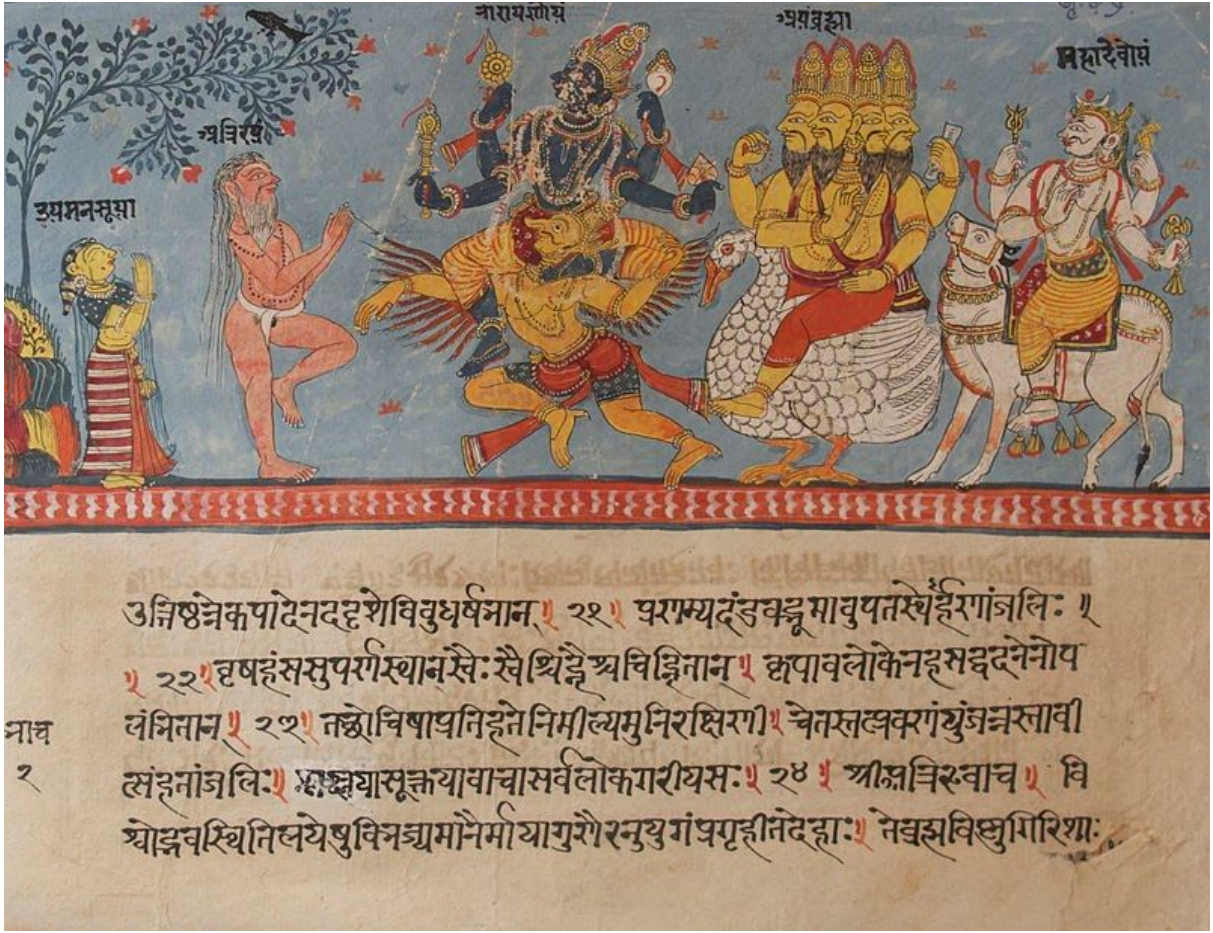
A Bhagavata Purana manuscript page depicting the story of Atri and Anasuya meeting the Trimurti (PhP 4.1.21–25) (paper, late 18th century, Jaipur)